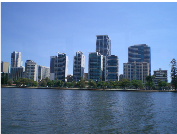
(Lejlighederne har også en fed udsigt til floden)

Efter kaffe og muffin, var der vinsmagning om bord med 2 hvide og 2 røde vine. Hertil blev der serveret et ostebræt med 2 oste og salami, samt kiks. Virkeligt lækkert.