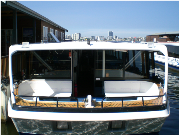
(Vores cruisebåd med plads til omkring 80-90, men vi var nok 50)

Turen gik i et mere end roligt tempo og vi så nogle fede hytter der lå næsten ud til floden. Vi fik fortalt at disse huse næsten alle sammen tilhørte familier med relation til mineindustrien.