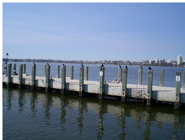
(Fuglene sidder klar hvis vi skulle tabe noget)