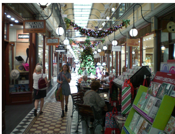
(Et fint gammel mall, hvor der er pyntet op til jul)

Adelaide er nok den af de australske byer vi har besøgt, som minder mest om England og der er mange træk fra Victoria tiden. Byen er rigtig hyggelig og når vejret var godt som i dag – 25-30 grader – er det bare at nyde det.