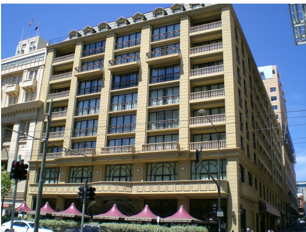
(Vores hotel i Adelaide)

Vi sov lidt længe i dag(igen) og gik ud for at få lidt let morgenmad. Temperaturen er allerede +25 grader.