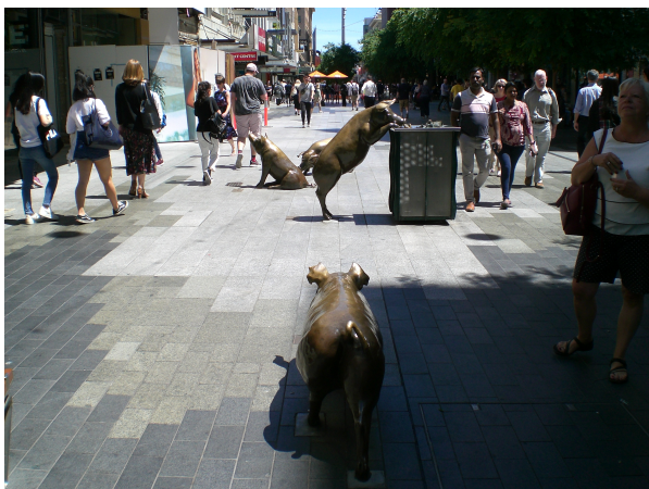
(Statuer uden for Pigs Mall tæt på hvor vi bor)