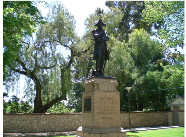
(Statue af Matthew Flinders – en af de store opdagelsesrejser i Australien)

Efter morgenmadsen slentrede vi ned mod South Australian Museum, hvor vi havde bestemt os for at tilbringe eftermiddagen. Temperaturen nærmer sig de 30 grader, så det er helt fint at være indenfor i kølige lokaler.