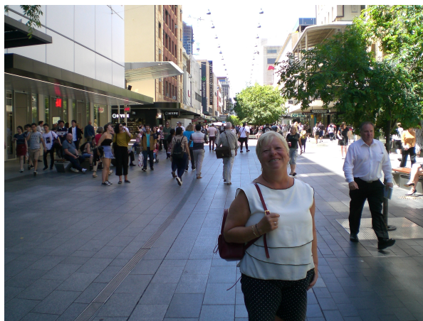
(Indkøbs gå-gaden i Adelaide)