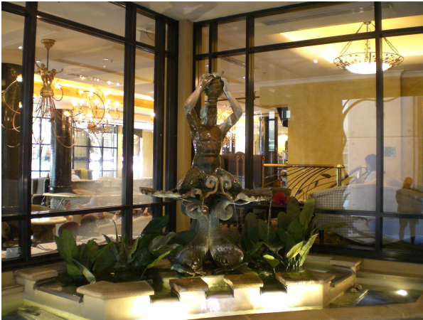
(En kopi af Bernini's Fontana del Tritone i Rom står lige udenfor vores hotelindgang. Lidt stil har man vel.)

Aftensmaden indtager i på The Little Hunter som ligger næsten skråt over for hotellet. Da vi ikke har spist frokost, tænker vi det nok går med lidt forret og en hovedret.