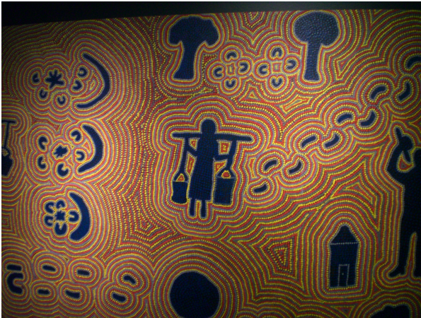
(Aboriginal malerier, som alle fortæller en historie. F.eks. hvor man kan få vand eller hvor der er mad)