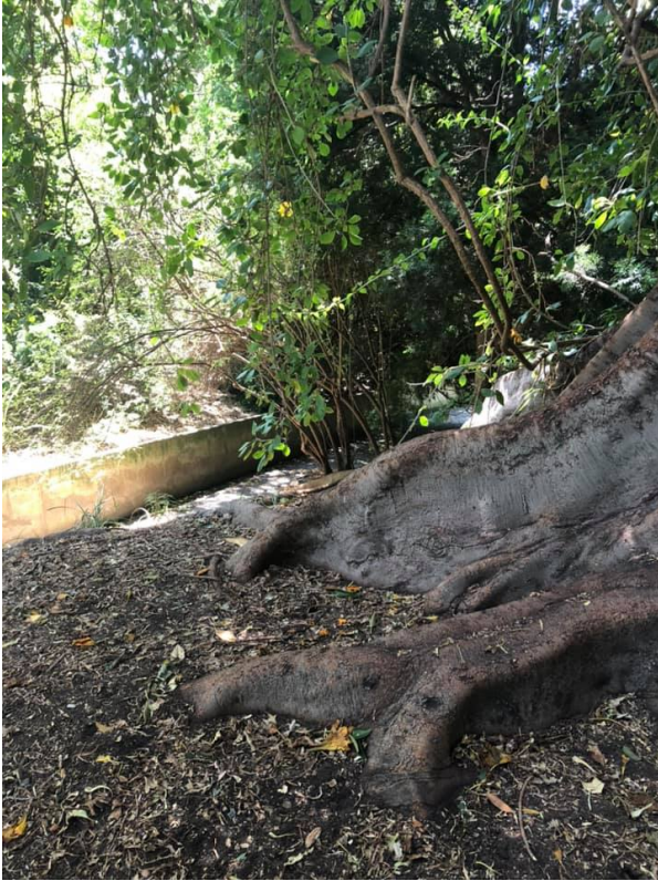
(Rødder på et træ, der tilsyneladende også vokser over jorden)